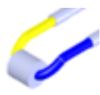
Eletro Coagulador-Ressector – Coagulation Roller